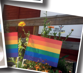
Vår Pridebakelse 2020.