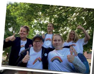
Delar av vårt husvärdsteam.

P.S. NÄSTA ÅR TÄNKER VI SÄTTA DEJE PÅ VÄRLDSKARTAN. D.S