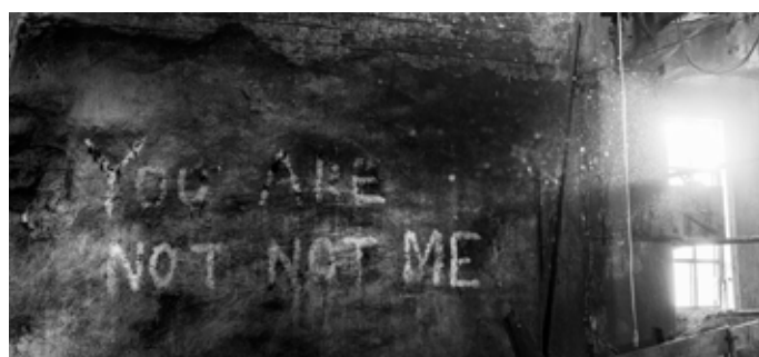
Terése Classon Sundh Konstfoto - plåttavlor i storformat