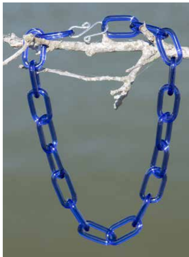
Ann Ardebrant Smycken av glas