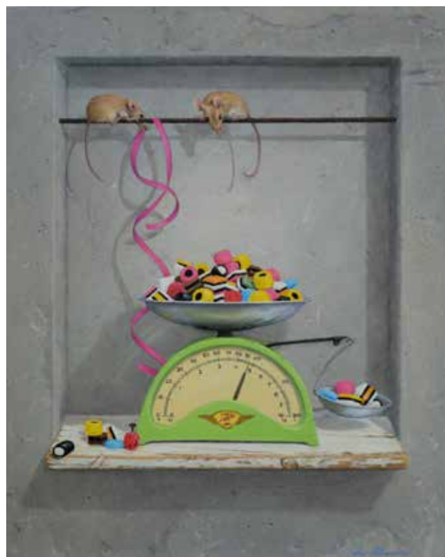
Lennart Nilsson Olja med trompe l'oeil effekt