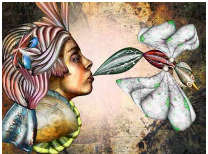
Mats Nyman 3D, digital grafik och skulptur