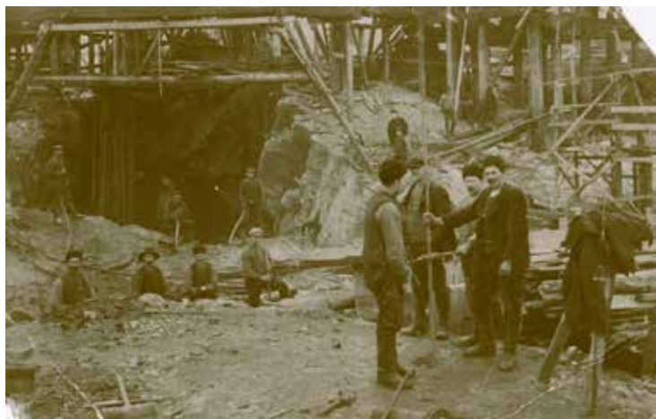
Arbetare vid kraftstationsbygget. Att få besök av fotograf var sällsynt.