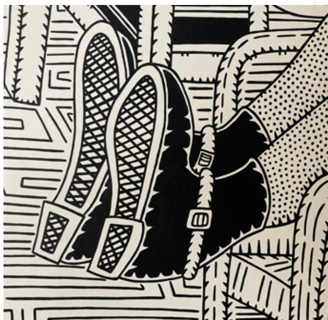
Dr Crix Mixedmedia

RAWSCULPTOR Skulptören från Göteborg som fantasifullt formar liv och lust i skrot och lera.