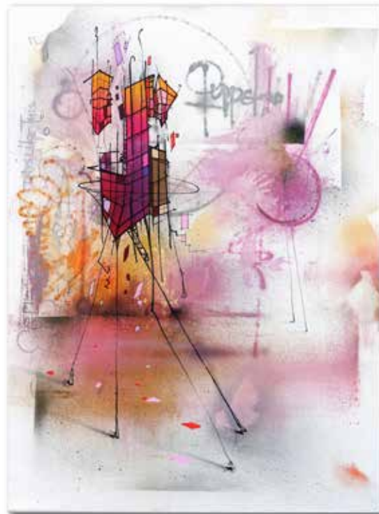
PUPPET gridwalker "a loose piece" 60x80 cm | 2024