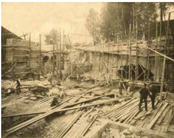
Klarälvens första kraftstation byggs vid Dejeforsen. Bilderna är från 1905.