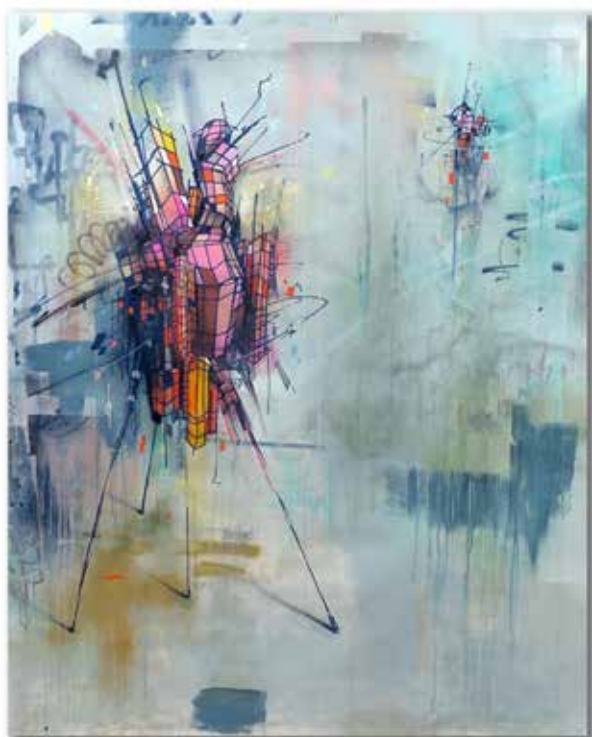
PUPPET gridwalker "blue ace" 120x140 cm | 2024